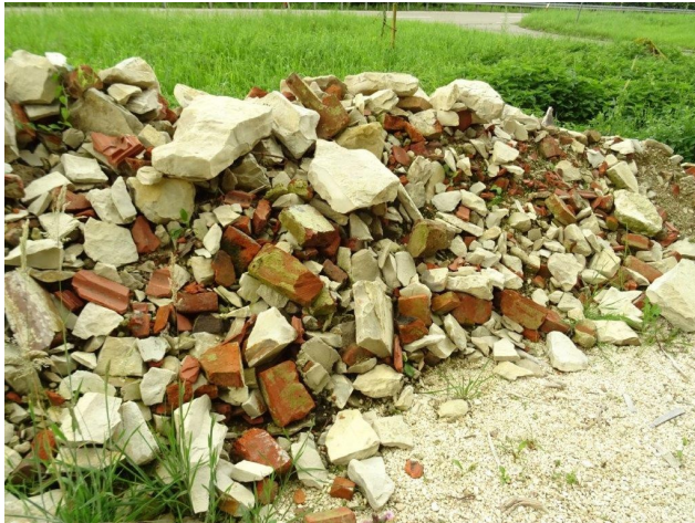
Dezimierter Steinvorrat am Parkplatz beim Aufgang zur Burg

7. Aus dem Abbruch eines alten Hauses hatten wir viele gute Bruchsteine erhalten, welche wir auf dem Parkplatz unterhalb der Burg zwischenlagern. Sie werden mit bei der Sanierung ihre Verwendung finden. Leider haben wir durch Diebstahl einen Verlust erlitten, dafür hat man uns Bauschutt zu den Steinhalden gekippt.