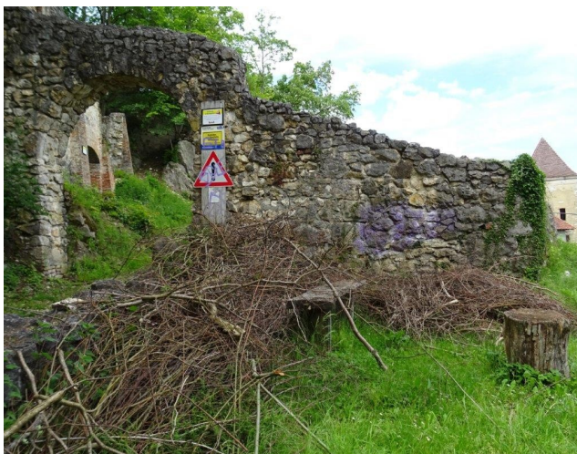
Eingangsbereich der Burg vor der Aufräumaktion des Technikteams