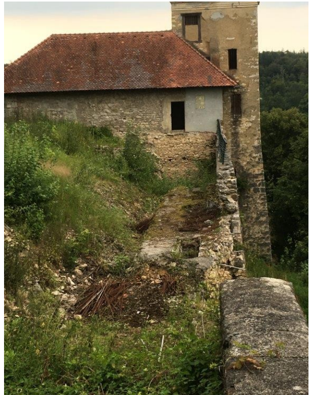
Die Eisen vor der Burgmauer wurden entfernt

Die letzten Hindernisse für die Sanierung vor der Mauer wurden nun vom Arbeitsteam beseitigt. Mit der letzten Fuhr wurden etwa 2,5 Tonnen Eisen abgefahren.