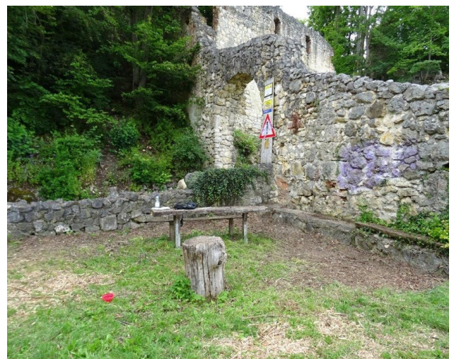
nach der Aufräumaktion