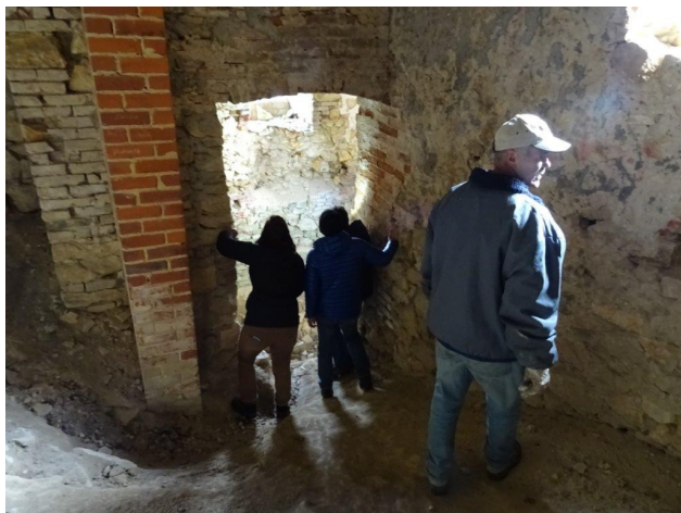
Kellergeschoss im Nordturm

Im Rahmen der Baustellenbesprechungen wurde klar, dass die Kellergeschosse der beiden Türme in sehr schlechtem Zustand sind. Bevor mit einer zukünftigen Nutzung begonnen werden kann, müssen diese Schäden an den Türmen aufgenommen, untersucht und in ein Sanierungskonzept gebracht werden. Wie es aussieht, wird uns die Arbeit an der Ruine nicht ausgehen.