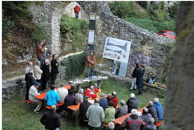
Präsentation der Baumaßnahmen auf dem Starterfest