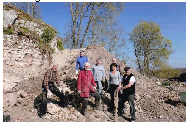
Arbeitssteam beim Steine aussortieren

Im Frühjahr dieses Jahres wurden bei mindestens fünf Arbeitseinsätzen von den wenigen aktiven Helfern Steine für die Mauer aussortiert – egal bei welchem Wetter, ob bei Dauerregen oder Sonnenschein.