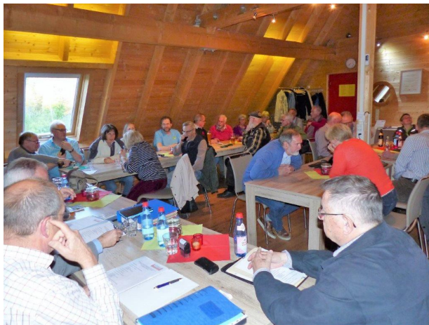
Bild von der Hauptversammlung am 10. Mai 2017

Im weiteren Ausblick stellte der Vorsitzende heraus, dass man die Ruine schnellstmöglich wieder der Öffentlichkeit zugänglich machen wolle, aber nach Vorliegen des beauftragten Sanierungsgutachtens im Rahmen der finanziellen Möglichkeiten schadhafte Mauerteile instand setzen müsse, um eine Gefährdung von Besuchern zu vermeiden. In einem LEADER-Projektantrag wurde die Förderung von Stromversorgung, Brauchwasserspeicher, WC-Anlage sowie Türen und Fenster für die Türme beantragt. Eine Planung für die Außengestaltung des Geländes wurde bereits angestoßen.