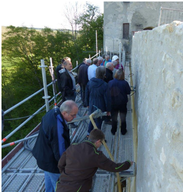
Das sanierte Mauerstück bei der Baustellenbesichtigung vor der Hauptversammlung am 10.05.17

Eine gefühlte Ewigkeit hatte es gedauert bis es mit den Bauarbeiten auf der Kaltenburg losging. Bereits im Winter 2006 stürzte ein ca. 6 m langes Stück der Umfassungsmauer herunter und bei Bauarbeiten 2010 fielen weitere 10 m Mauer in die Tiefe. Über 10 Jahre lang konnte der Innenhof des Burggeländes wegen der beschädigten Mauer nicht mehr richtig genutzt werden. Als dann im April 2014 die Heidenheimer Zeitung den kläglichen Zustand der Ruine beschrieb, startete Clemens Stahl einen Aufruf, der dann zur Gründung unseres Vereins führte.