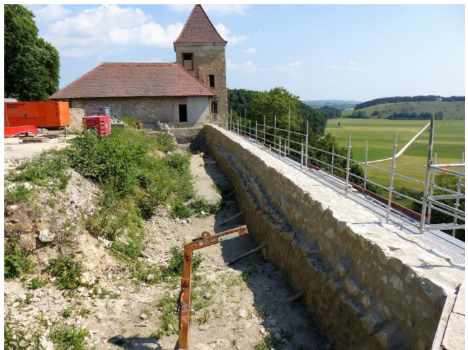
Sanierte Mauer vor Verfüllung des Hofbereiches am 20. Juni 2017