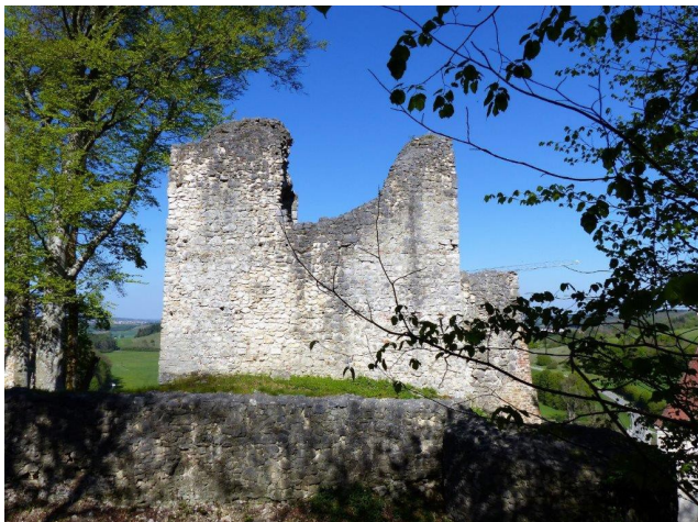
Schildmauer der Kaltenburg Mai 2017