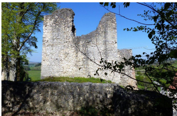
Die westliche Schildmauer

Für alle drei Sanierungsbereiche wurde in Abstimmung mit dem Landesamt für Denkmalpflege die sog. „Denkmalschutzrechtliche