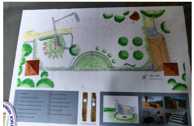
Entwurf für den Innenhofbereich

In der letzten Mitgliederversammlung hatten wir einen Gestaltungsentwurf zum Atrium vorgelegt und beschließen lassen.