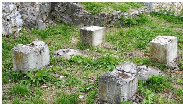
Hier wurden die morschen Sitzbänke entfernt