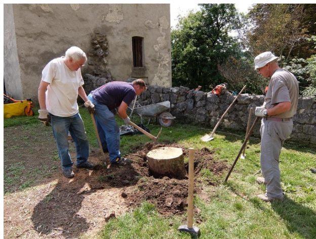
Fleißige Helfer beim Arbeitseinsatz auf der Burg