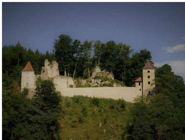
Dieses Bild ist als Postkarte erhältlich