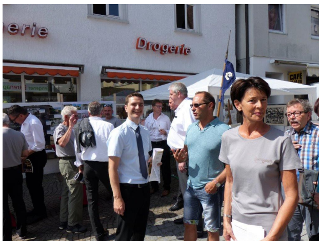
Einige Eindrücke von unserem Informationsstand auf dem Reichsstadmarkt