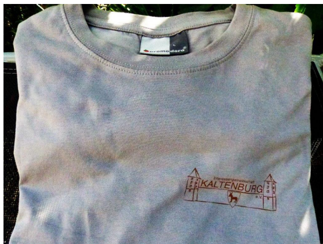
T-Shirt mit Logo-Aufdruck