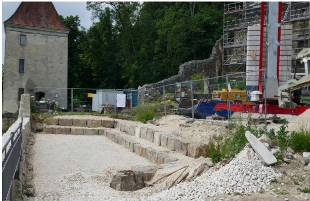
Blick ins Atrium

Anlässlich des „Tages des offenen Denkmals“ im September wollen wir das Atrium feierlich einweihen.