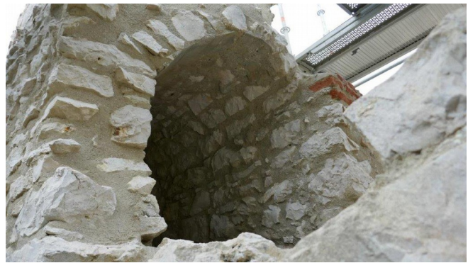
Gewölbe und Abdeckung sind sauber gearbeitet und machen auch optisch einen sehr guten Eindruck