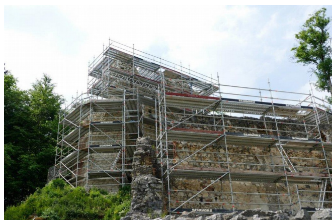
Burganlage mit Baugerüst