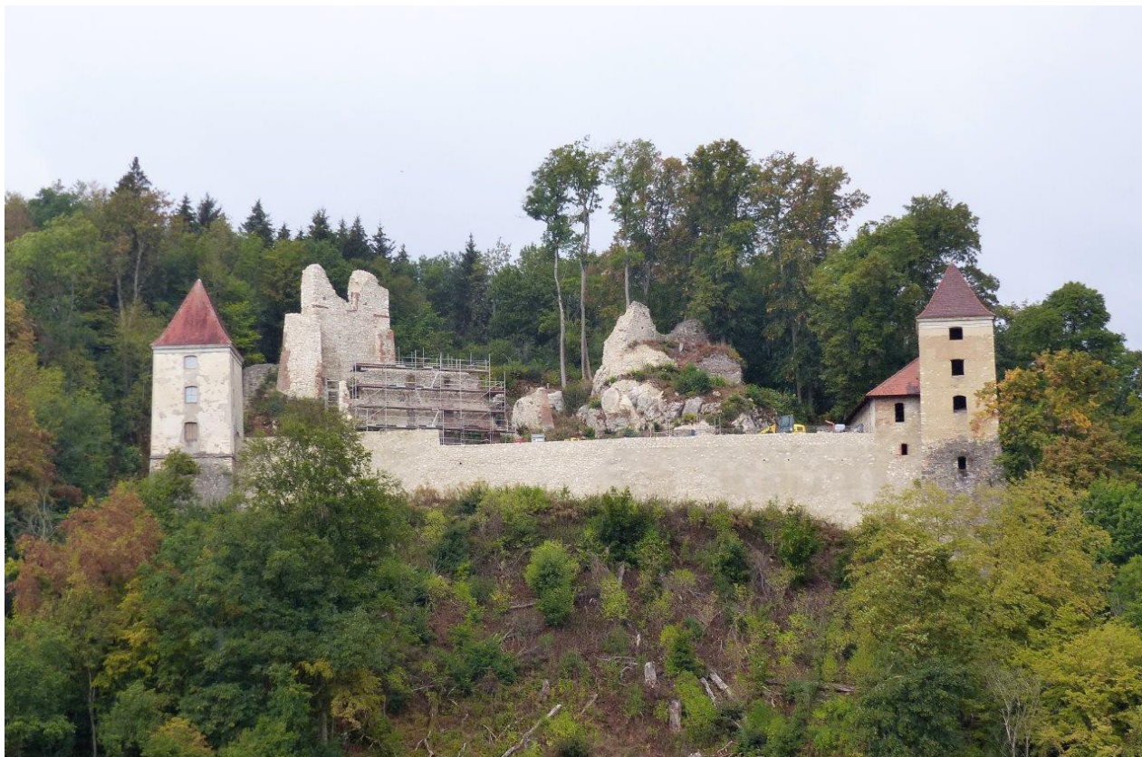
Die Kaltenburg Ende August 2018 kurz vor Abschluss der Renovierungsarbeiten