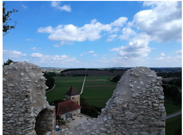
Blick über die Schildmauer ins Lonetal