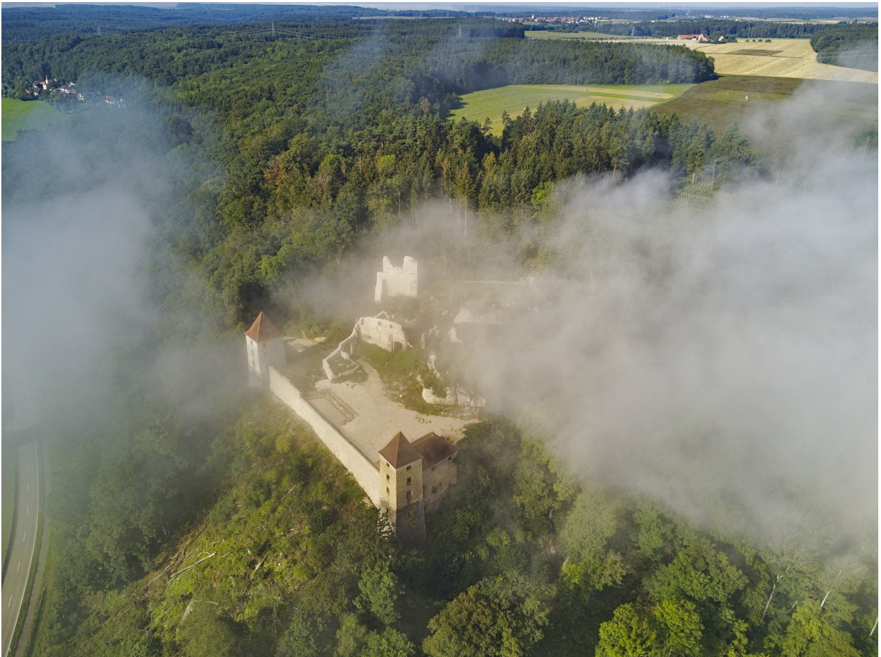
Kaltenburg in Wolken – im Hintergrund rechts Reuendorf

Informationsblatt der Interessengemeinschaft Kaltenburg e.V. Jahrgang 2020 15.02.2020 Ausgabe 25