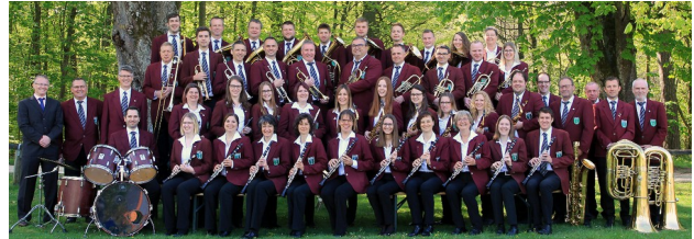
Musikverein Stadtkapelle Niederstotzingen

Sonntag, 28.Juni, von 11 bis ca.14 Uhr Frühschoppenkonzert im Burghof mit der Stadtkapelle Niederstotzingen (incl.Bewirtung)