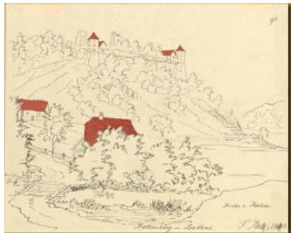
Die Abbildung von 1843 zeigt den Weiler Kaltenburg mit den noch bewohnten Gebäuden

Durch den Kauf der angrenzenden Rittergüter Kaltenburg und Stetten konnte er nun sein Herrschaftsgebiet wesentlich erweitern.