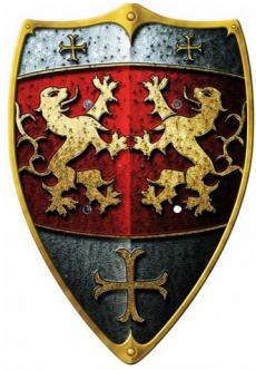
Hier beispielhaft ein Waffenrock und ein Schild für Kinder