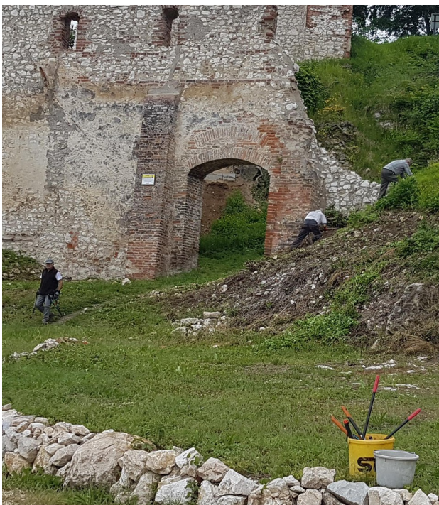
Rückschnitt von Sträuchern