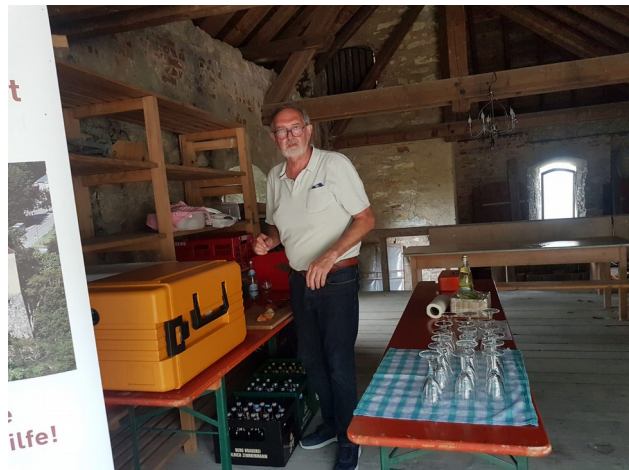
Gästebewirtung am Pfingstsonntag