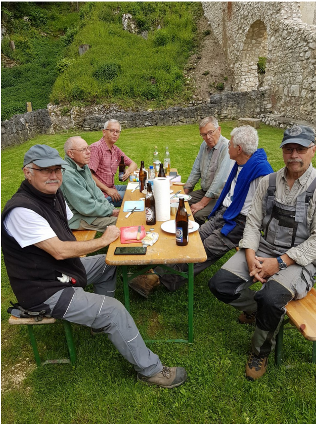
Brotzeit nach getaner Arbeit