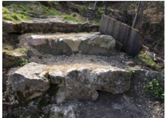
Ausbesserung der Treppenstufen