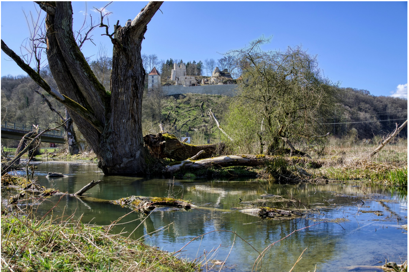
Zusammenfluss von Hürbe und Lone: Kaltenburg im Hintergrund

Informationsblatt der Interessengemeinschaft Kaltenburg e.V. Jahrgang 2022 15.06.2022 Ausgabe 31